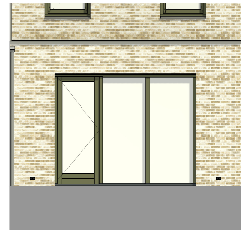
Aanzicht achtergevel Schaal: 1 : 50